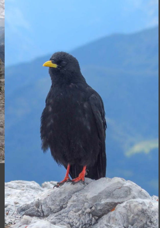
Pique-nique au sommet (2807m) avec les choucas